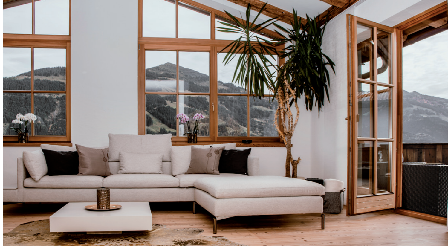
Residenz am Berg in Jochberg bei Kitzbühel - www.residenzamberg.at