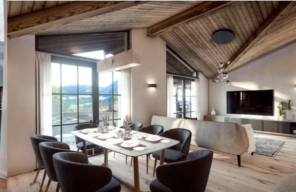
Kitz Joch Residence