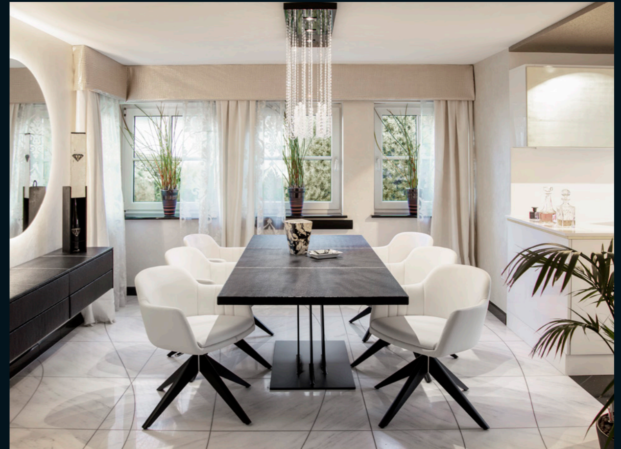
Außergewöhnliche Oberflächen wie „Dessert-Leder“, Kristallglas oder Blattsilber veredeln private Wohnräume oder auch den gewerblichen Bereich gleichermaßen