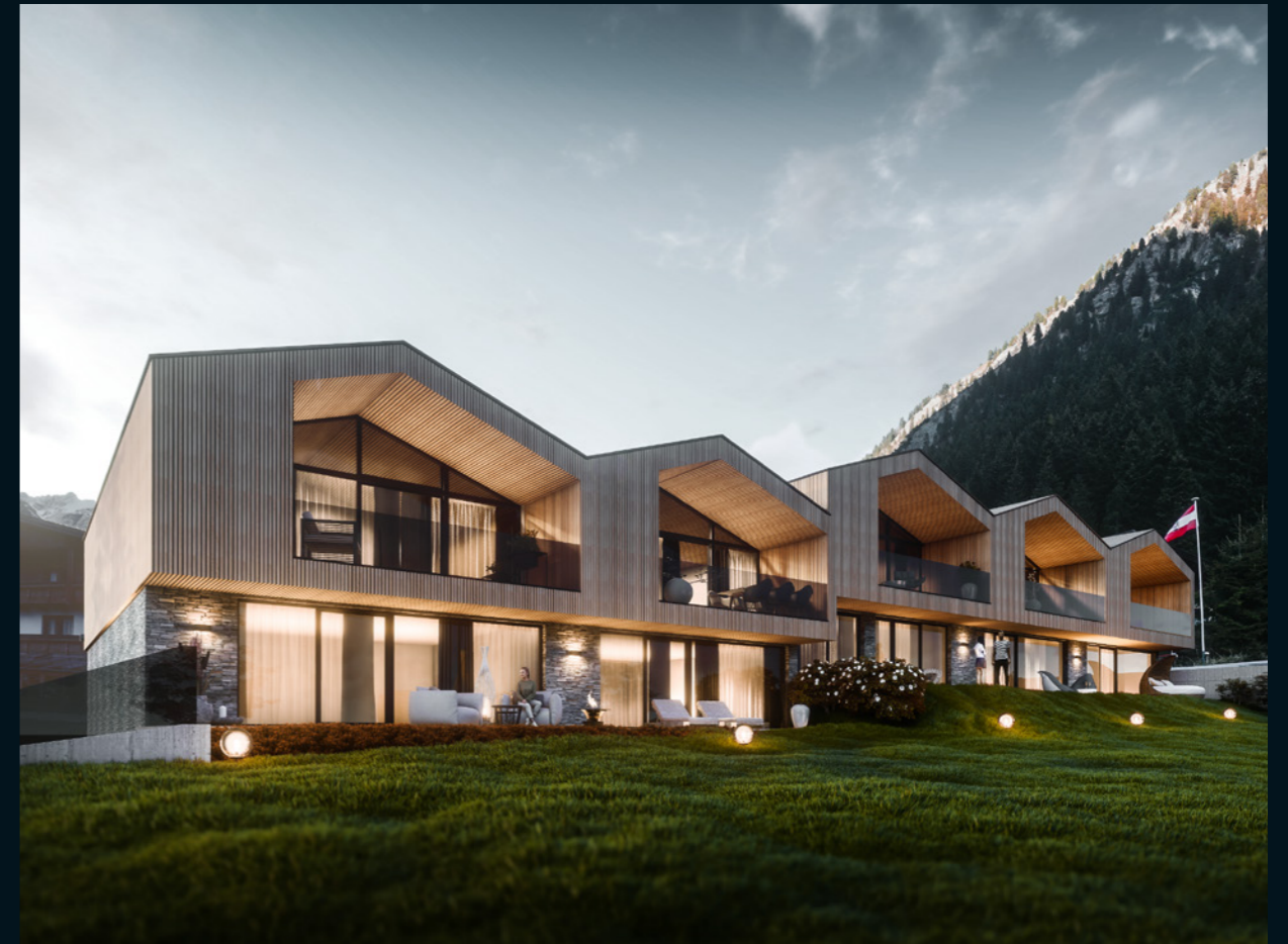
Panorama Chalets Pitztal - traumhafter Ausblick bei professioneller Einrichtung