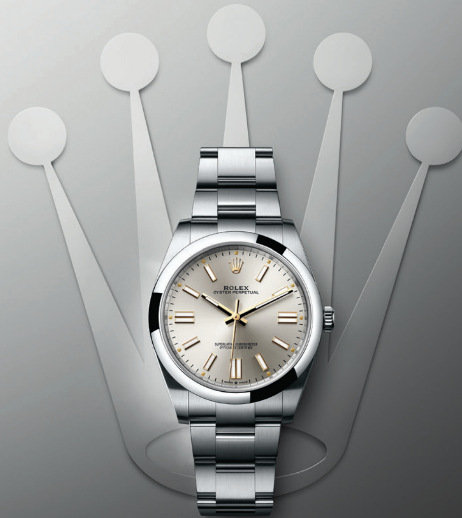
OYSTER PERPETUAL 41